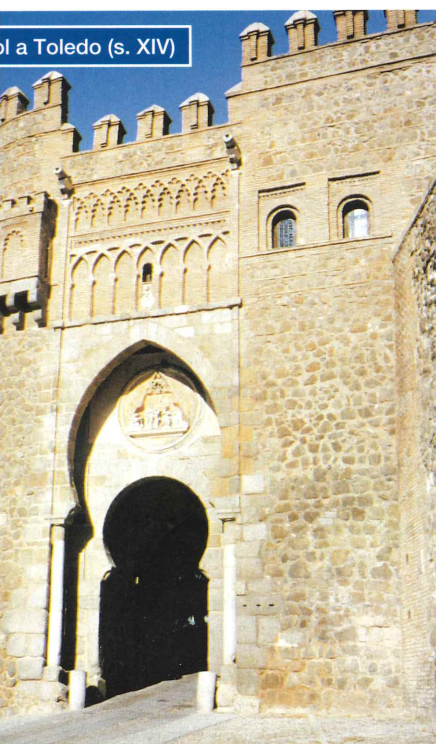
al Toledo (s. XIV)