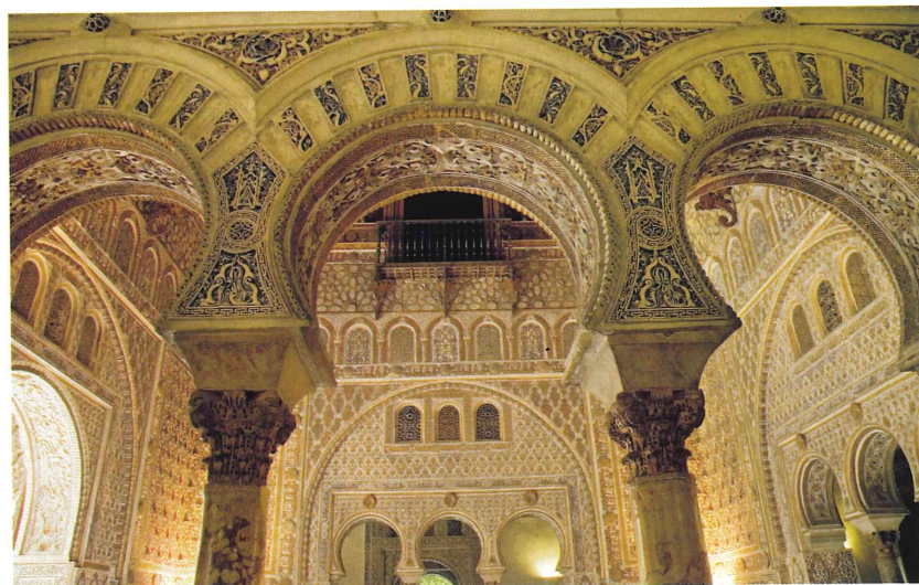
Reales Alcàzars de Sevilla, Saló dels Ambaixadors (s. XIV). És un palau mudèjar, amb arcs de ferradura que descansen sobre un potent cimaci.